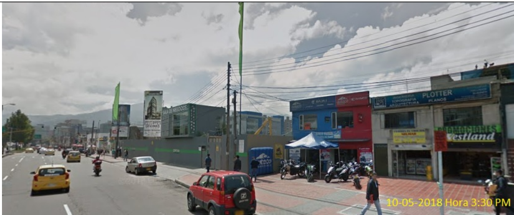
Foto.4: vista panorámica del inmueble, donde estaba instalada la valla en la Avenida Calle 100 No. 49 - 25 (dirección catastral).