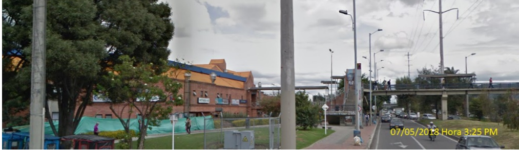
Foto.1: vista panorámica del inmueble donde se instalará el elemento de PEV, en la Carrera 46 No. 152 - 46 (dirección catastral) orientación Sur-Norte, (sitio nuevo del traslado).